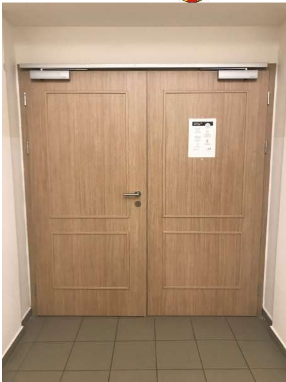
(ODDĚLUJÍCÍ POŽÁRNÍ PROSTOR NA CHODBĚ)